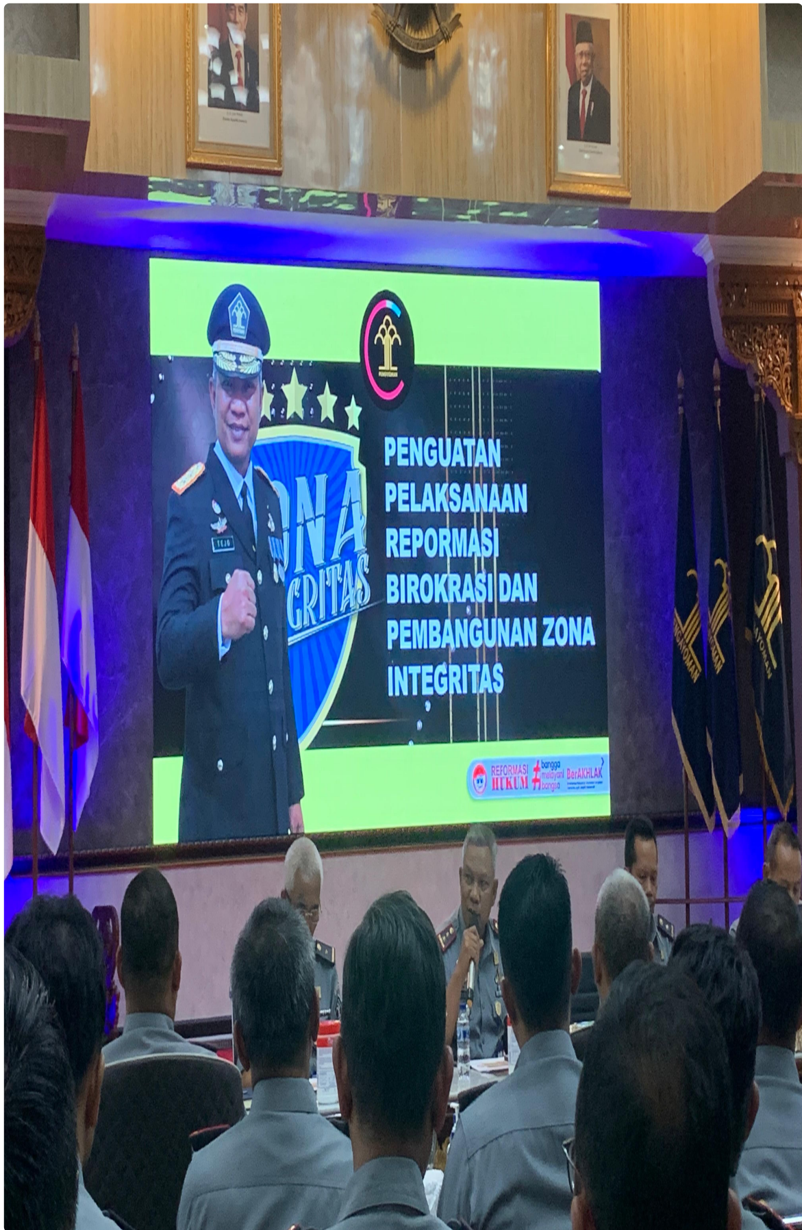
Kebumen- Rumah Tahanan Negara (Rutan) Kelas IIB Kebumen ikuti Penguatan Pembangunan Zona Integritas (ZI) menuju Wilayah Bebas dari Korupsi (WBK) dan Wilayah Birokrasi Bersih dan Melayani (WBBM) yang diselenggarakan oleh